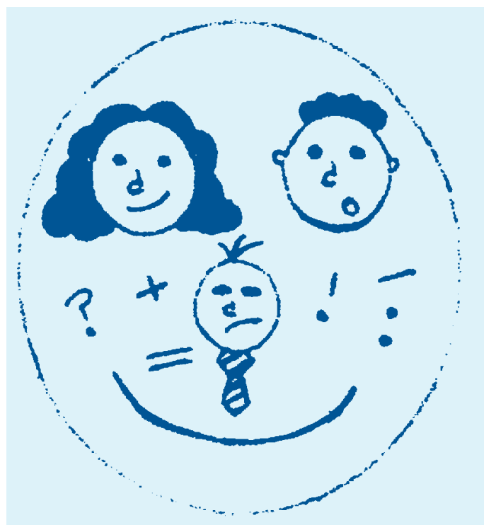
Ilustracje do tej serii broszur wykonały dzieci ze szkoły Westfield Middle School w Bedford (gimnazjum Westfield w Bedford).

Gdy miejscowe władze prześlą Tobie końcowe oficjalne oświadczenie, nadeślą również szczegółowe informacje dotyczące prawa do składania odwołania. Możesz wtedy rozważyć wniosek o mediację lub złożenie odwołania do trybunału SENDIST.